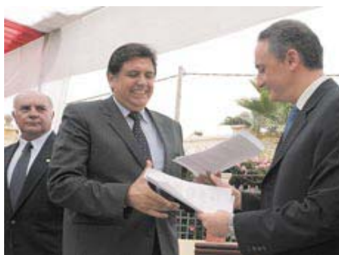
Alan García, candidato del APRA

limpieza o no de sus métodos, los peruanos le aducían la finalización del problema guerrillero. Sin embargo, SL parece haber recuperado poder de fuego en los últimos meses y todas las miradas se dirigen a los casi 1.700 detenidos que fueron liberados para reinserirse en la vida civil. Este, que es el gran tema de debate en la opinión pública pone del mismo lado en su acusación al gobierno de Toledo al candidato oficialista (¿?) Belaunde Aubry de Perú Posible y al mítico Alan García (APRA). Ambos creen que el saliente mandatario no ha sabido manejar la situación y que por ello ahora sufren las consecuencias.