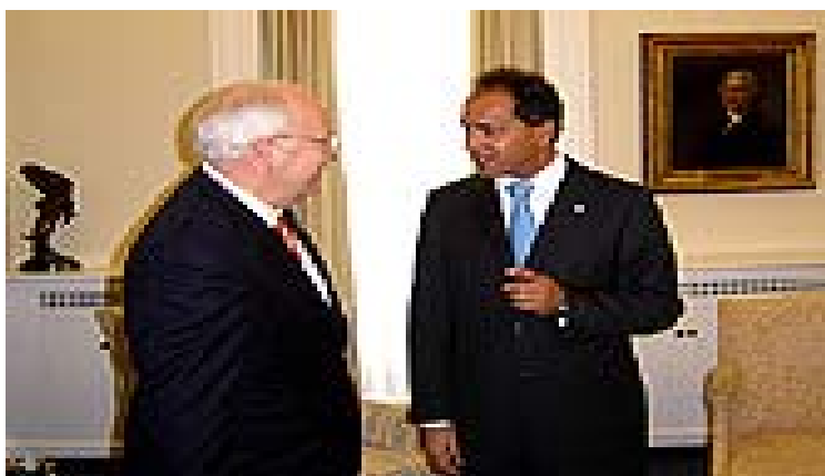
El Vicepresidente Daniel Scioli con su par norteamericano Dick Cheney. Los Kirchner son mas afectos a los demócratas en tanto el ex moto nauta es más pragmático..

Scioli, lejos de entrar en polémicas mediáticas aclaró que no responderá a través de los medios de comunicación y reafirmó que no piensa renunciar ya que quiere ser el primer Vicepresidente que complete su período desde el retorno a la democracia. Es conocido por todos que el ex piloto tiene claras intenciones de ser Jefe de Gobierno de la Ciudad de Buenos Aires en el 2007, un espacio que también pretende el Jefe de Gabinete Alberto Fernández. ►