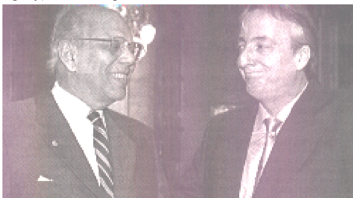
Las papeleras son parte de la política de Estado de Uruguay. El ex Presidente Jorge Batlle ya había impulsado la instalación de las empresas española y finlandesa.

Los cortes de ruta para no poder acceder al vecino país encresparon los ánimos de localidades vecinas, donde hasta las familias están (al igual que en toda zona fronteriza) mezcladas. El aislamiento que se provoca con los cortes plantó el tema de las patrias, ya que en un primer momento las manifestaciones