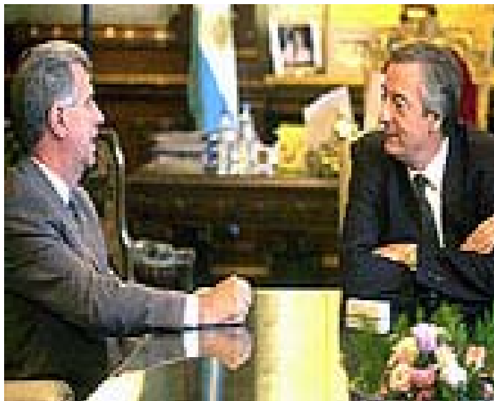
Tabaré Vázquez y Néstor Kirchner son afines ideológicamente, aunque en lugar de mejorar las relaciones bilaterales se encuentran en el peor momento de la historia.

La pregunta es recurrente no solo en nuestra nota sino en los despachos oficiales. ¿Cómo se sale de este