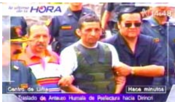
Humala, gran candidato

El ingreso a un acuerdo amplio con Estados Unidos (en la Cumbre de Mar