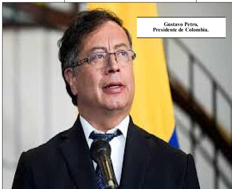
Gustavo Petro, Presidente de Colombia.

Asamblea de las Naciones Unidas para poder hablar en libertad. Hablé contra el genocidio en Gaza, ¡cómo me hubiera gustado acompañarlo para hacer la paz en Gaza! donde los palestinos me quieren y quizás si en vez de ir a capturar a un presidente