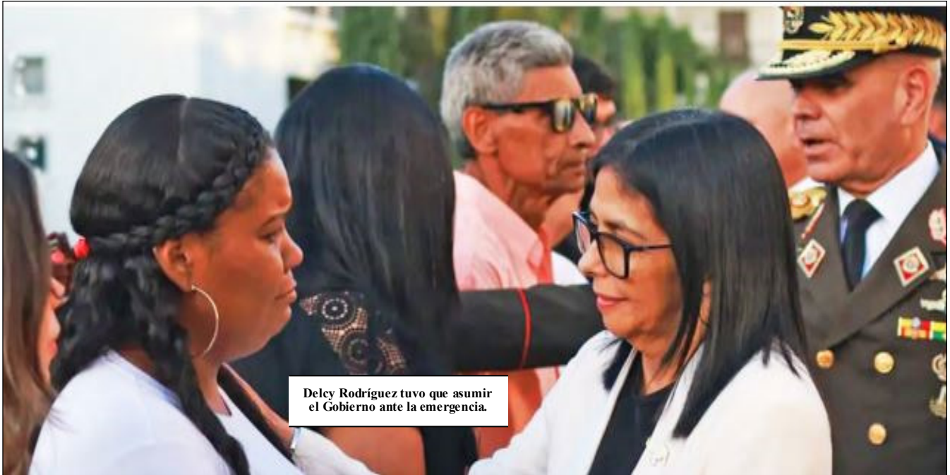
Delcy Rodríguez tuvo que asumir el Gobierno ante la emergencia.