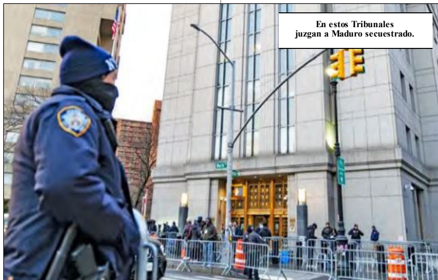
En estos Tribunales juzgan a Maduro secuestrado.