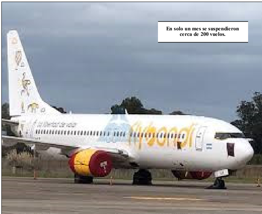
En solo un mes se suspendieron cerca de 200 vuelos.

Daniel Scioli, Secretario de Turismo de la Plutocracia, lejos de apoyar a